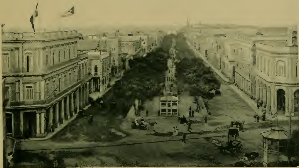
Vista del Prado. The Prado.